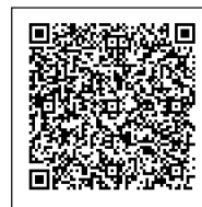
QR-Code defumus- Anfahrt (Googlemaps)

defumus® Rauchschutz-Technik GmbH Boschstraße 62-66 | 50171 Kerpen Tel.: 02237-50698-0 | Fax: 02237-5069899 Internet: http://www.defumus.de E-Mail: info@defumus.de Bürozeiten: Mo.-Do. 8:00-12:00 Uhr + 13:00-17:00 Uhr, Fr. 8:00-14:00 Uhr