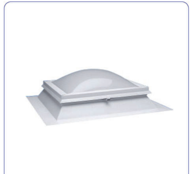
Lichtkuppel classic LK